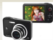
Máquina fotográfica GE J1455