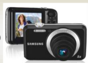
Máquina fotográfica Samsung ES80 5X