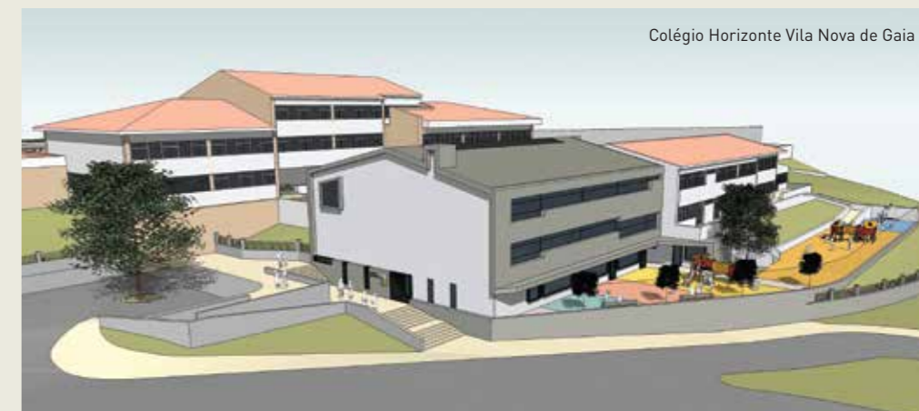
Colégio Horizonte Vila Nova de Gaia